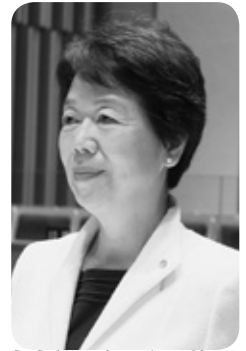
中橋 友子 議員 (日本共産党 幕別町議員団)