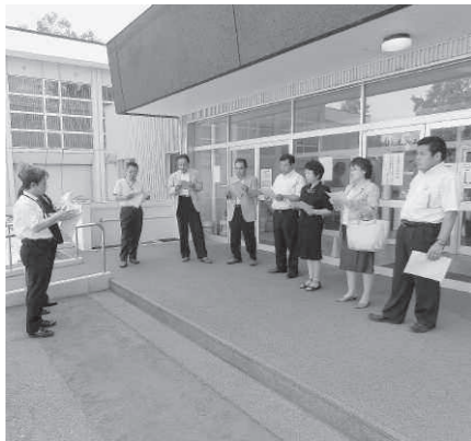
札内中学校生徒玄関前