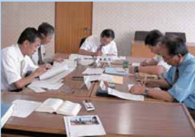
議会だよりの編集に取り組む委員