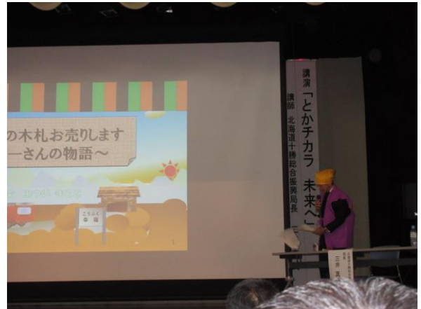
三井総合振興局長の講演