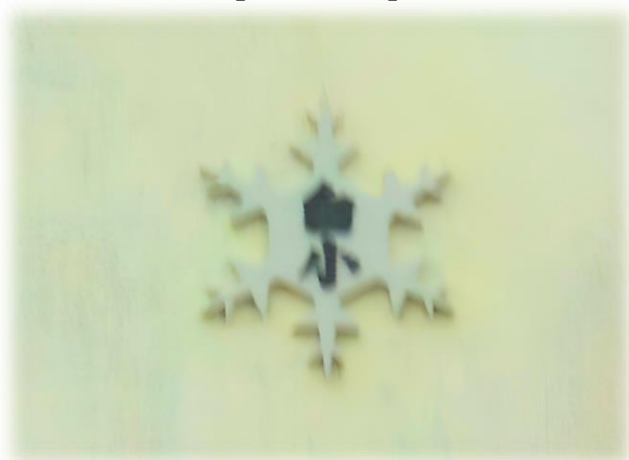
【玄関に取り付けられた新校章】