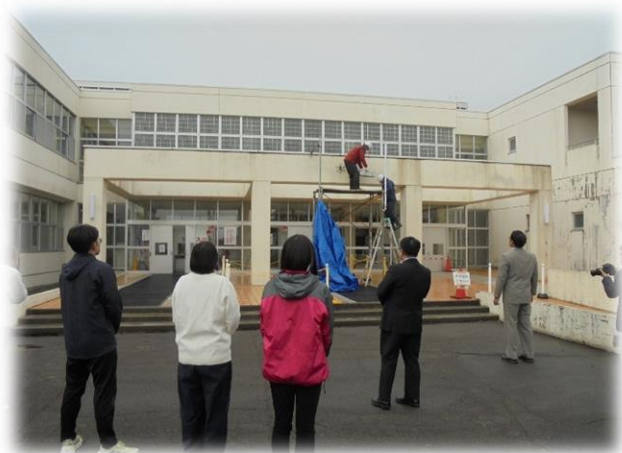
【学校職員も見守る中取り付け】