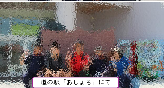
道の駅「あしよろ」にて