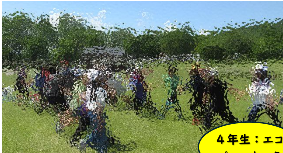
4年生：エコ パ・ハナック