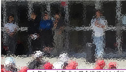
4年生「花いちもんめ～♪」