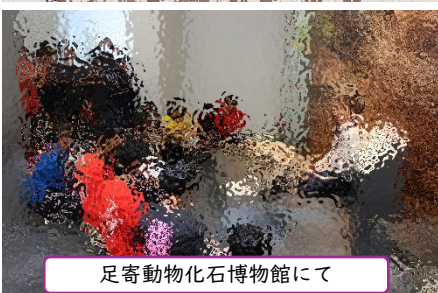
足寄動物化石博物館にて

6月11日～12日の1泊2日、足寄にて宿泊学を実施しました。1日目は探究活動(JA 足寄や役場へのインタビュー活動)、キャンプファイヤーなどのレク活動を行いました。2日目は足寄動物化石博物館で化石発掘実習などを行いました。学級みんなで協力し充実した2日間を終えることができました。