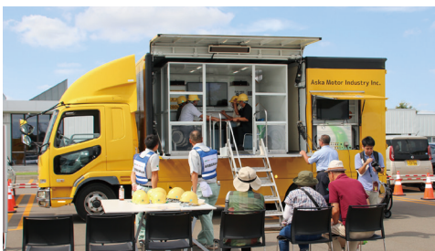
◀「防災フェアでの地震体験車の様子」(令和7年)

A 地域活動促進のため、町内会活動支援交付金等で側面的な支援を継続する。町内会連絡会議での情報共有も充実させ、町内会相互における情報共有の機会の充実にも努める。活動継続が困難な町内会には、実情を把握し、地域課題解決を支援する。