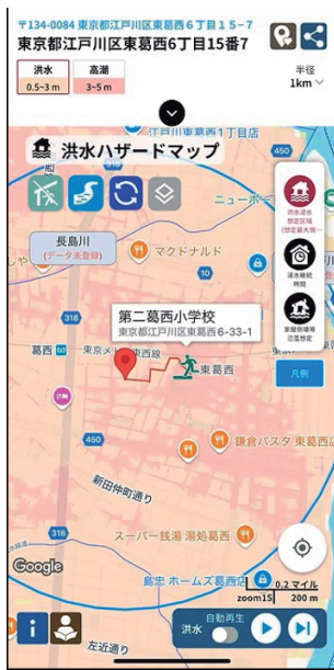
▲耳で聴くハザードマップ

Uni-Voice Blind とは、印刷物の文字情報をスマホカメラで読み取り、音声で聞くためのアプリです。