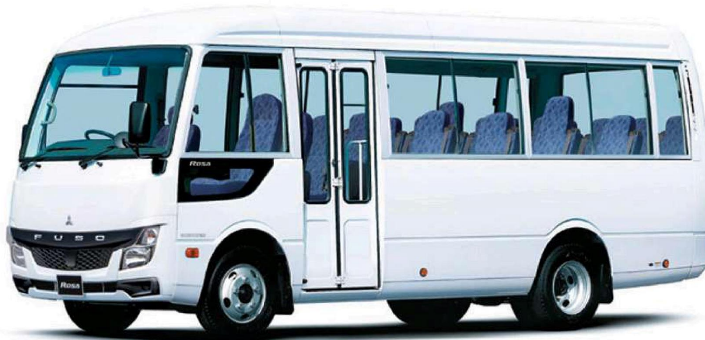
■ 4WD車 ロングボディ