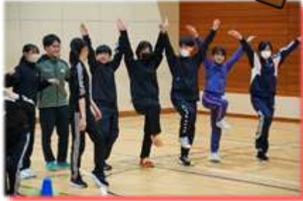
↓チームで記念撮影