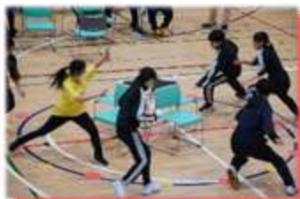
↑白熱のいす取りゲーム