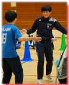
↓「伝わってくれ!」 ジャスチャーゲーム