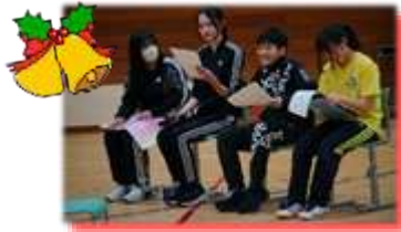
↑企画・進化した 書記局メンバー

生徒が生徒たちの手で創り上げる行事は、忠類中ならではの温かい雰囲気の中、大成功で終わることができました。