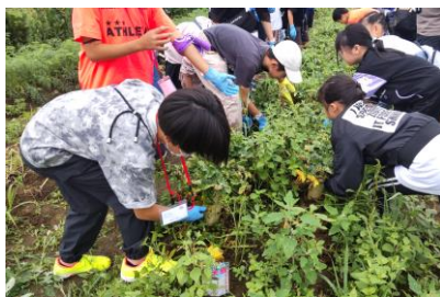
北王農林にて (開成町)