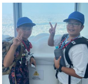
スカイツリーにて