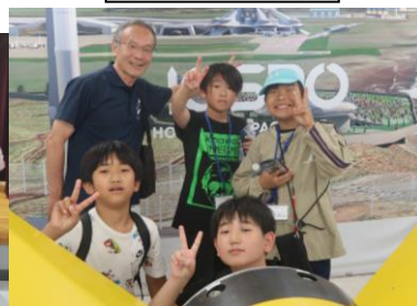
大樹町宇宙交流センター SORA にて (中土佐町)