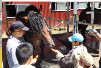
ばんえい牧場にて (中土佐町)