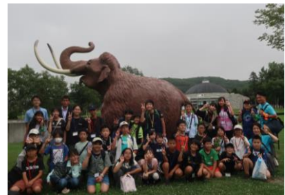
ナウマン象公園にて (開成町)