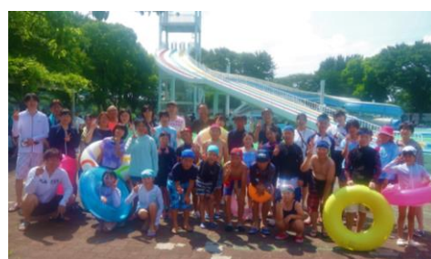
大和田プールにて