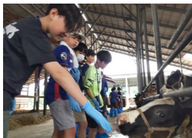
共栄牧場にて (開成町)