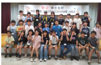
防災体験研修にて (中土佐町)