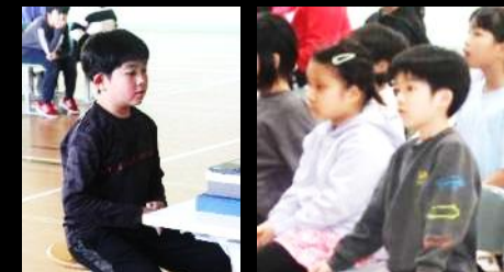
【かぼちゃプロジェクト・オンライン授業】