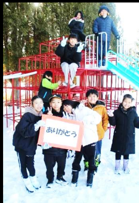
【きれいになった遊具の前でパシャリ】