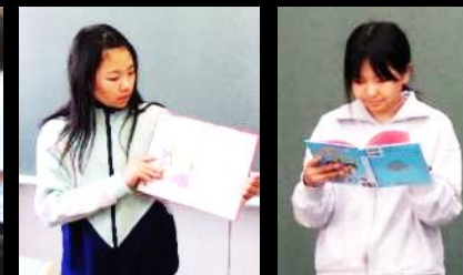
【たてわり読書での読み聞かせ】