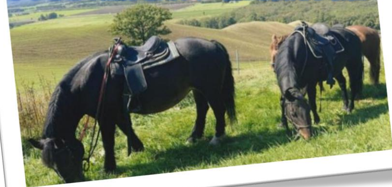
「風のテラス、風景と馬と」 第13回 I LOVE まくべつフォトコンテスト優秀賞

忠類が誇る素晴らしい景観を一望できるシーニックカフェ。今年も、子どもたちはカフェの魅力を存分に味わい、その素晴らしさを多くの人に伝えようと、さまざまなアイデアを出しながら取り組みました。各学年で作成したものが完成しましたので、ご紹介します。