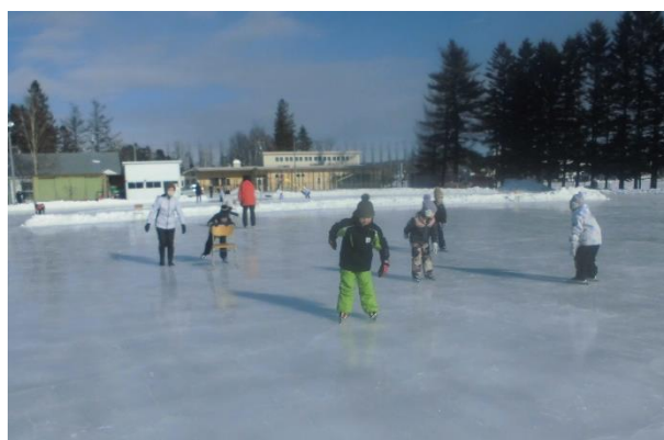
【スケートを楽しむ子ども達(2年生)】