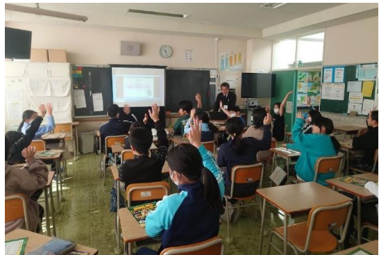
【薬物乱用防止教室の様子】

正しい知識を身に付け、必要な薬を正しく摂取することの大切さを学ぶことができました。