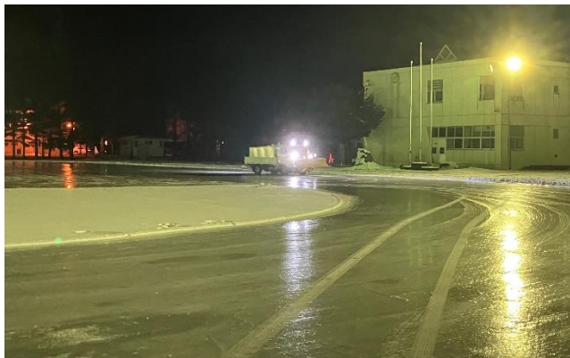
【リンク造成・散水作業の様子】

また、低学年では、ひも結びのお手伝いにご家族の方々にお手伝いいただいています。併せてお礼申し上げます。30日・31日には、スケート記録会も予定されていますので、是非、応援にいらして下さい。