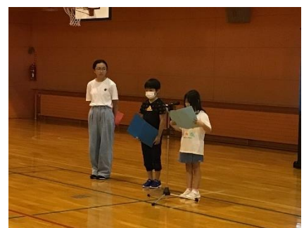
【始業式で発表する代表児童】

二学期は、頭をフルに活用することで、子ども達の学力や情操、未来への意欲を高めていきたくと考えています。