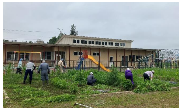
【学校農園の草取りをしていただきました】

学校が困っていること、なかなか時間がとれないことなど、親身になって相談に乗ってくれる地域の方々に心より感謝申し上げます。次年度からは、畑の先生としても活躍してもらいたいと考えています。