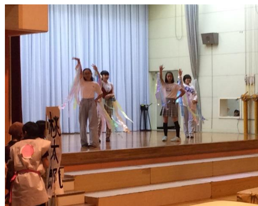
【6年生の劇の一コマ】

最後になりましたが、ご多忙の中、ご来校いただいたご来賓の皆様、保護者、地域の皆様に心より感謝申し上げます。