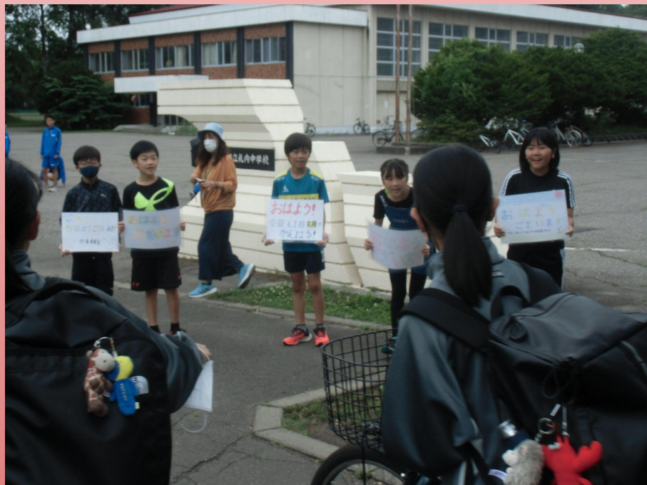
札幌南小中学校の校門にて