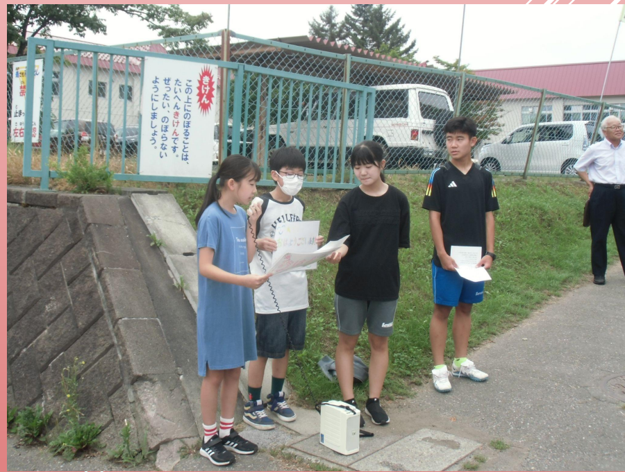
札幌南小周辺通学路にて