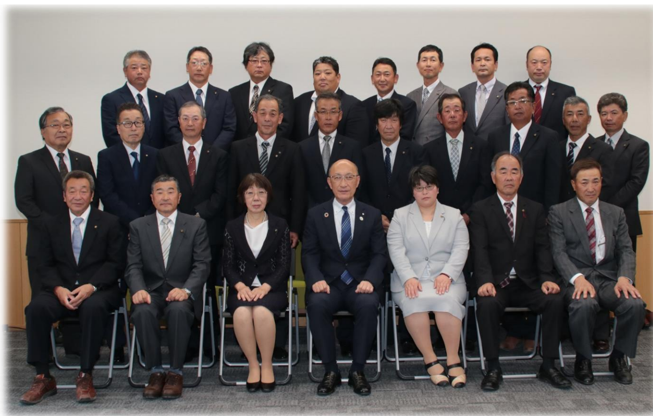
第24期幕別町農業委員（令和2年7月20日）