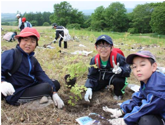
『まくべつ元気の森』森林体験事業での植栽の様子