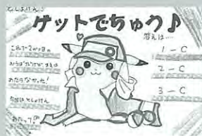
PN. ピカチュウ 11歳