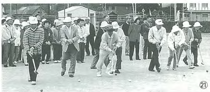
▶パークゴルフなら負けないぞ