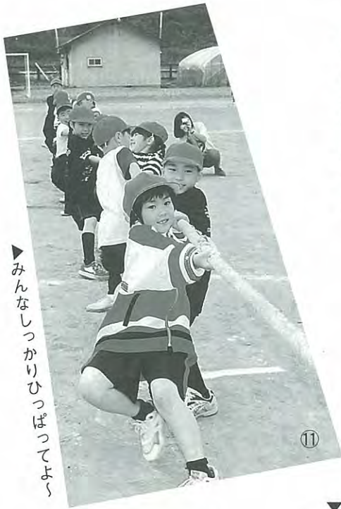
▶みんなしっかりとひっばってよ〜