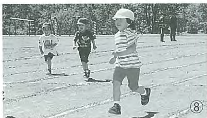
▲がんばって走ろうと