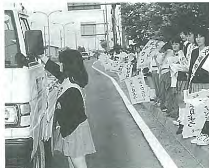
6月9日に実施された江陵高校の街頭啓発

お年寄りによる自転車事故多発!! 最近、お年寄りによる自転車の事故が多発しています。事故防止のため次のことに気を付けましょう。 ・慣れた道路でも十分に左右を確認し、横断する ・青信号だからといって安心せず、横断するときは左右を確認する ・夜間は自転車も点灯し、反射材をつける ・運転者も自転車を見かけたら、十分気をつける