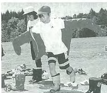
▲うまく着れないけど、いっちゃえ〜