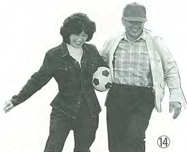
▲ちょっと、てれるな〜