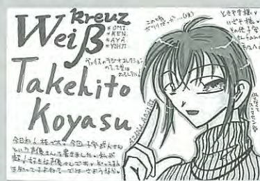
PN. 梧字 15歳