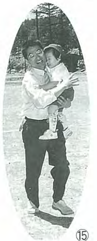
▶パパ、がんばってね!!