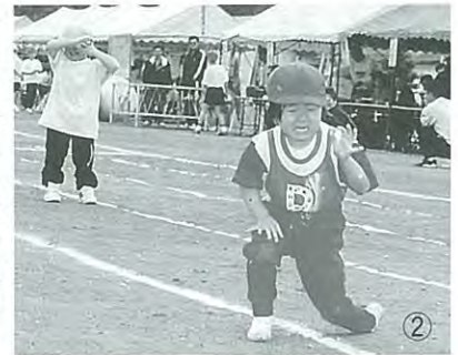
▶うえくん、ころんじゃったよ