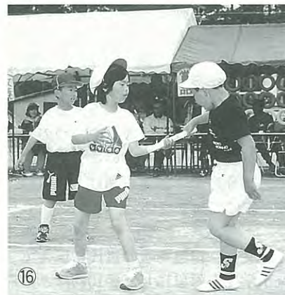
▲しっかりバトンをたのむよ!