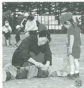
▲ママ、どうしたの?早くして!!