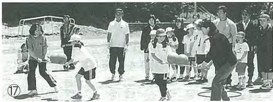
▲ゆっくり、あせらずにね!