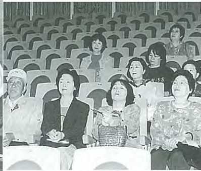
▼保健福祉センターでは、高齢化社会を意識して真剣なまな差しでした。