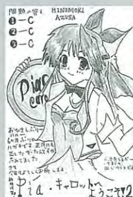
PN. インフィニティ 13歳