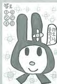
高木 弘香 12歳