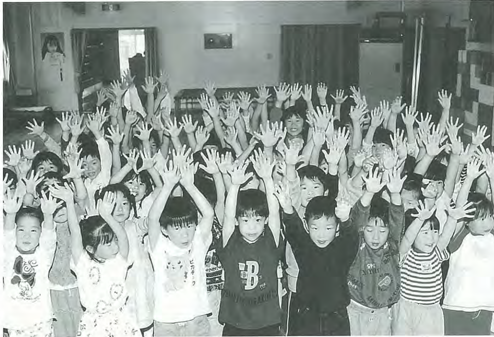
▶十勝竜谷学園幕別幼稚園の子どもたち