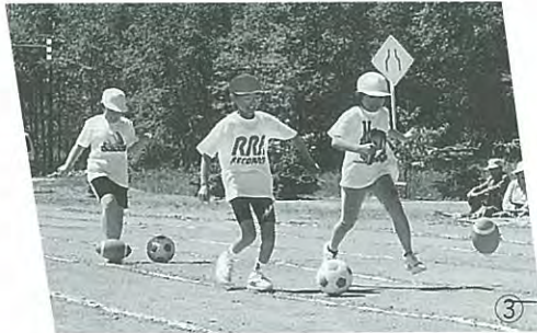
▲目指せ! ワールドカップ!!