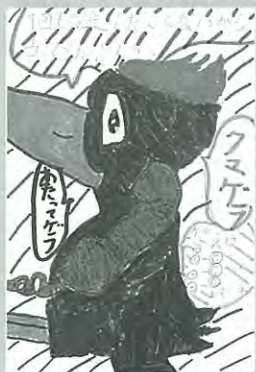
PN. ピカチューすき 12歳