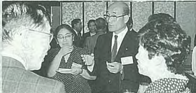
東京幕別会で懇談する町長