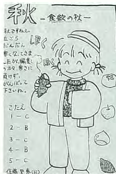
桂町 佐藤史恵 13歳

熊谷絵梨(7・相川) 斉藤尚子(9・青葉町) 長田まいこ(6・駒島) 佐々木隆(14・共栄町) 鈴木えりか(?・緑町)