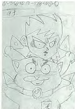
駒島 中村智和 9歳