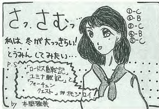
by 本間雅崇 あかしや町 PN本間雅崇 ?歳

☺十一月に入りますと、漬けものの時期です。我が家でも少し漬けますが、野菜の値段が気になります。消費者の立場から