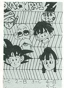
相川 奥田由紀 11歳