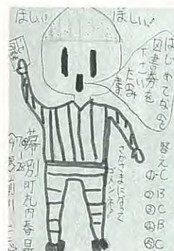
春日町 前川仁志 9歳

もったいのしく、親しめる広報にするためガンバリますので、隆君も、どしどし意見をよせてくださいね。みんなでつくる広報です。よろしく!