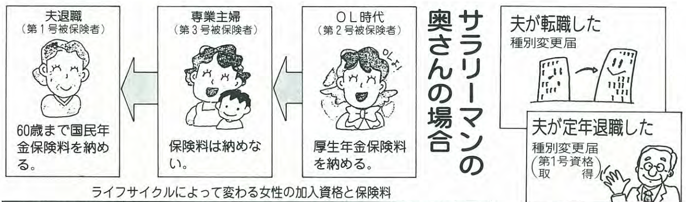
ライフサイクルによって変わる女性の加入資格と保険料