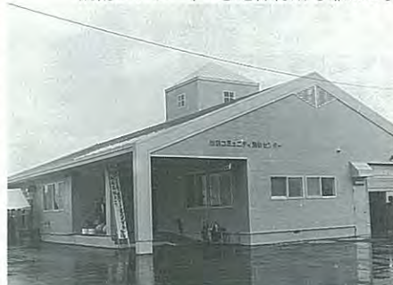
11月1日に完成した途別コミュニティ消防センター、へき地保育所も兼ねる。