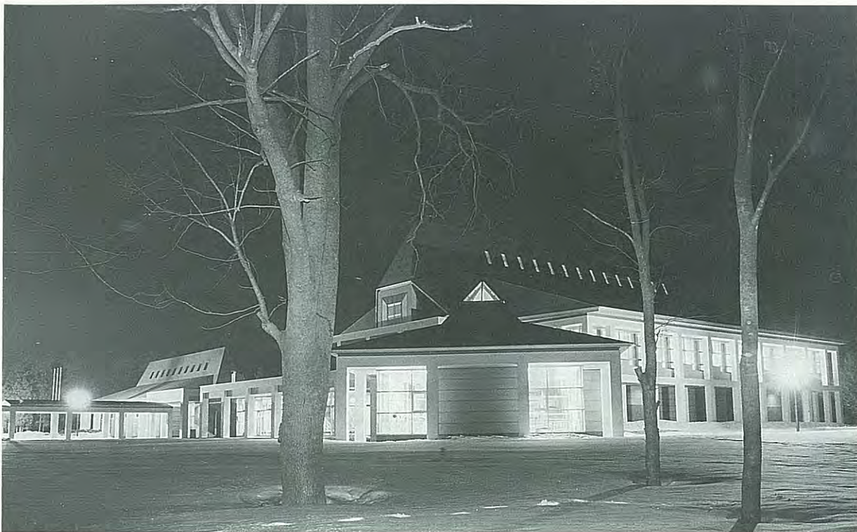
12月3日にオープンした札内スポーツセンター。オープン行事はまだ記憶に新しいところ。昭和63年11月8日に着工し平成元年11月30日に完成した。総工費は9億5,800万円で、元年度の工事費は6億8,000万円。土・日は1日中利用者が引きも切らず、12月4日から1月末までに6,998人が利用した。夜もなかなか美しい。