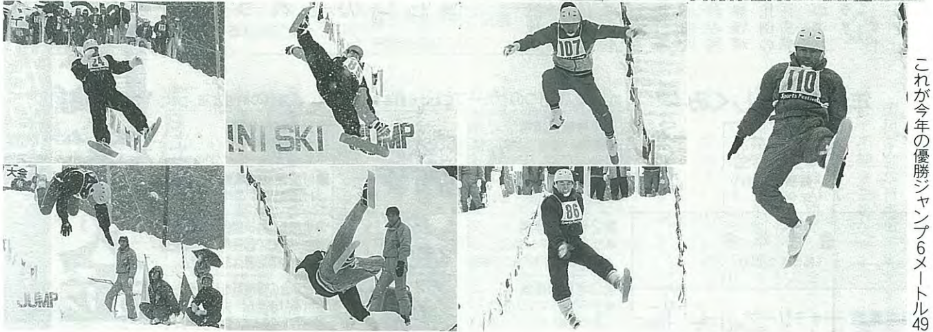
これが今年の優勝ジャンプ6メートル49