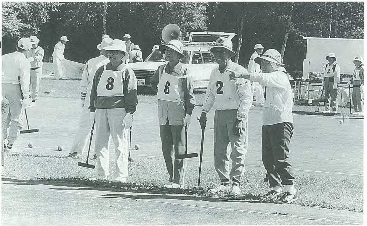
元年度にゲートボール協会が発足。9月30日に第1回の協会長杯の大会が行われた。老人福祉の一環として75歳以上のお年寄り1,009人に敬老祝金を支給。また老人クラブに対して会員1人当たり1,600円を1,700人分助成した。