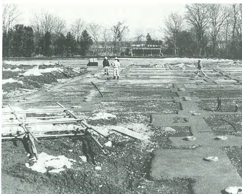
札内スポーツセンターは下部工事の真最中。まるで弥生時代の遺跡発掘現場のようです。建物がどんなふうに進められていくのか、自分の目で見るのも楽しいでしょうね。