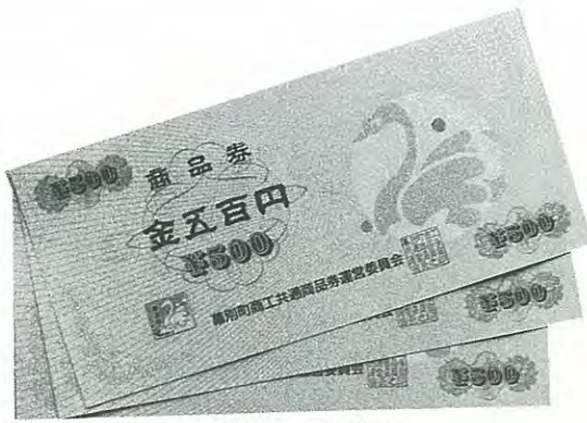
これが幕別の商品券です

商品券は、左のステッカーのあるお店に置いてありますので、そしてお買い求め下さい。