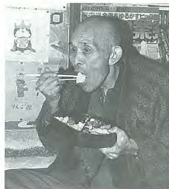
65歳以上のひとり暮らしの寄食サービスは、10月1日から3週間実施します。