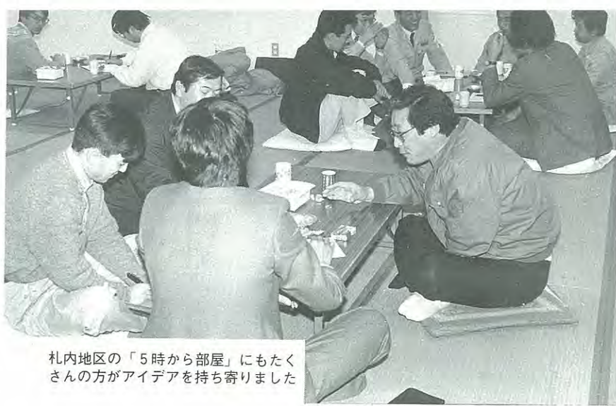
札内地区の「5時から部屋」にもたくさんの方がアイデアを持ち寄りまし