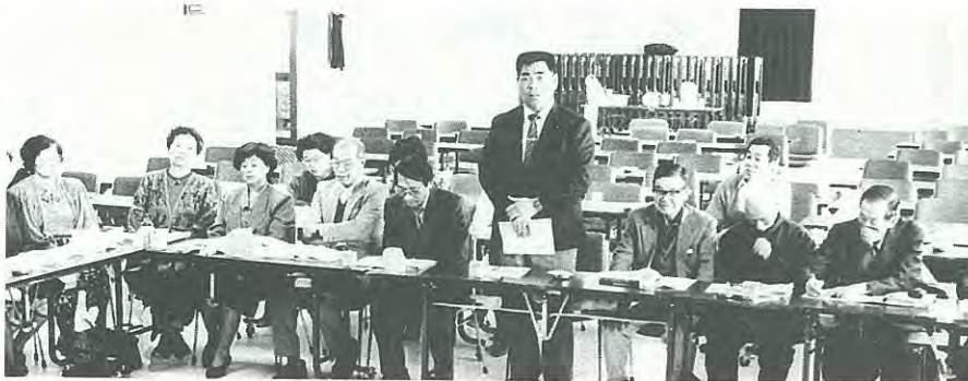
日常生活の中から活発な意見が出された分科会