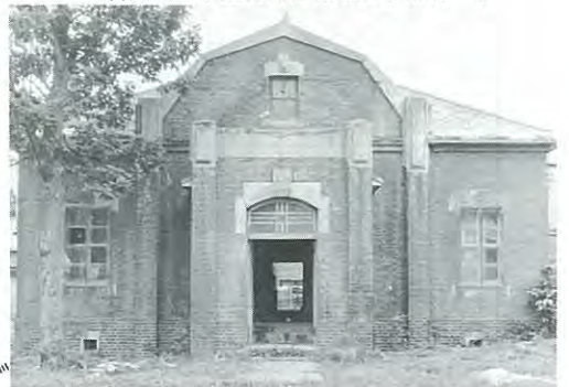
新田ベニヤ工業内にある旧事務所

積みになっています。レンガ造りは構造的に地震や凍土に弱いのですが、この建物には地下室があり、その基礎も深さ二メートル、幅四十センチの厚さがあります。また腰壁も地壁面から約七十センチまでは焼過ぎレンガを使い、寒冷地ということを良く配慮した設計となっています。