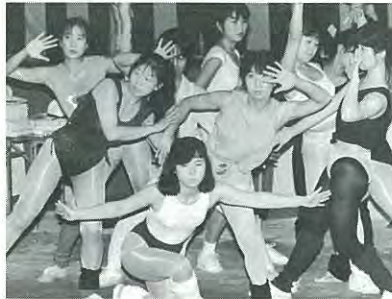
迫力のあったジャズダンス