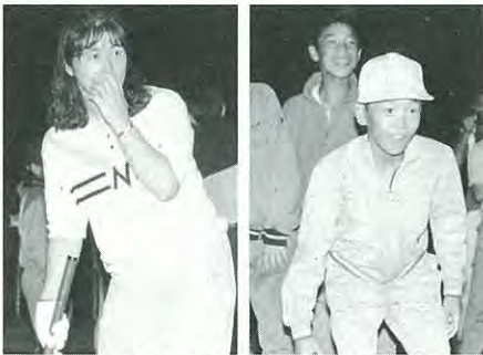
パークゴルフのホールインワン大会 あれノと入ったノのお2人