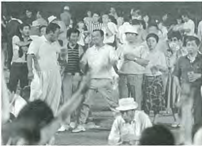
この人達の視線は