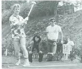
私は暑さに負けてしまいました