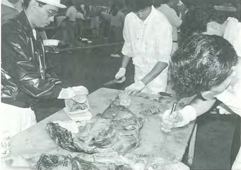
200人分用意しましたが、あつという間になくなりました

夏のお祭り・サマーカーニバル'88が八月六日、運動公園で行われ、約五百人の町民でにぎわいました。今年の人気の的はサホーク種綿羊の丸焼きで、二百人分を用意しましたが、あつという間にみんなの胃袋の中へ入ってしまいました。このほかにジャズダンスやホールインワン大会、抽選会もあり、夏の夜を楽しみました。