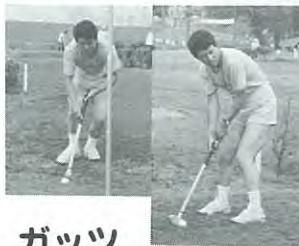
ガッツ ポーズが出れば バーディだ!