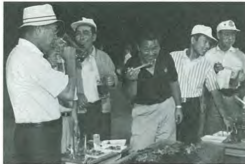
ジンギスカンもおいしいよ、食べる？