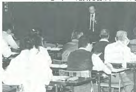
ルールとマナーの説明を受け、コースで実技研修(認定会)

国際パークゴルフ協会は七月十二日、公認指導員、アドバイザーの認定会を初めて開き、道内から約四十人が参加しました。参加者はルールとマナーの説明を受けたあとコースで実技を学び、指導員二十三人、アドバイザー十六人が認定されました。