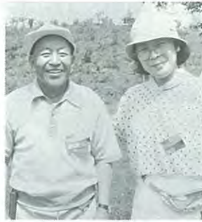
ナイス・ショット