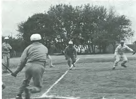
接戦のすえ打ち勝った対芽室戦

一回戦はソフトボールが町技になつている強豪芽室町チームと対戦し、初回到八点を奮い楽勝かと思われましたが後半攻め込まれ、