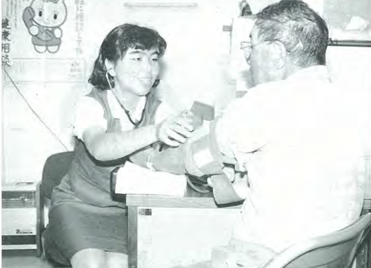
表5 保険税賦課状況比較 (昭和63年3月末現在)