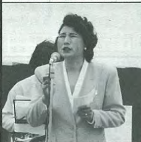
梅介の漫談で大爆笑