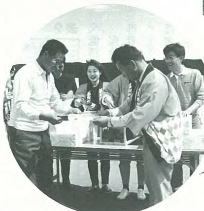
お楽しみ抽選会で当選