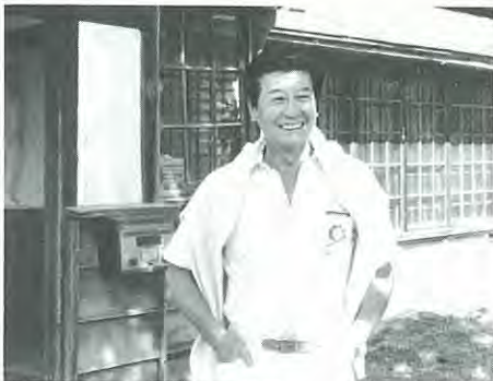
新田牧場の事務所前で