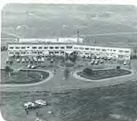
オープン当時の全景