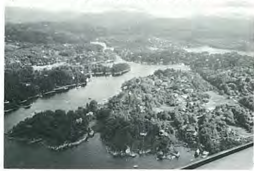
森と湖の点在するフィンランド