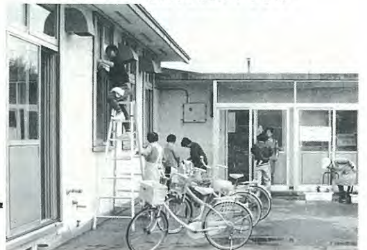
窓ふきに汗を流す公区のみなさん

本町近隣センターができてから五年がたちました。今までは本町一公区で環境整備をしてきましたが、五年をきっかけに本町二、三と幸町公区も誘ったところ、五月十九日当日は五十人が集まりました。みんなで窓ふきや座布団カバーの洗濯、花だんに花を植えるなど、近隣センターは中も外もピッカピカになりました。