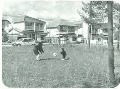
今年整備される桜町の公園予定地

▼止若公園は芝生とジョギングコース 延長七十メートルのジョギングコースと二百五十平方メートルの芝を植えま