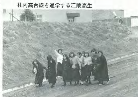
札内高台線を通学する江陵高生

▼幕別地区の墓苑化を進める 区画墓地(八十)の造成、駐車場(約三十台)の舗装、ベンチの設置や植栽を行い、二年目の本年度で整備を終えます。