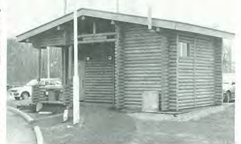
焼肉ガーデン前のトイレに車いす用が

お貸しする金額は一万円以上十 万円以内、利率は年三％で、一年 以内に償還していただきます。 開発商工課労政係 ☎54-21 11 内線235 にご相談下さい。