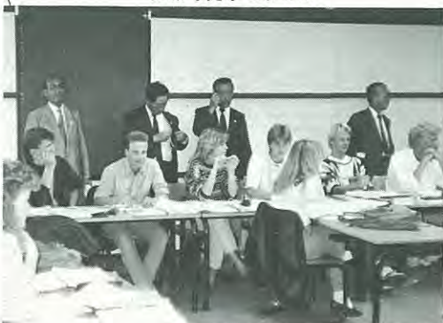
授業も見学しました