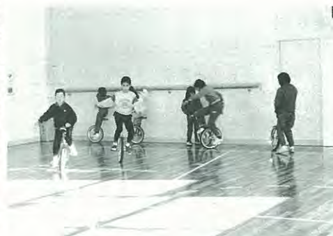
さっそく体育館で一輪車を練習する子供たち