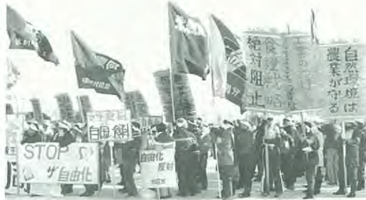
むしろ旗や各団体旗が並んだ会場

一月十日、午前十一時から相川の十勝畜産農業協同組合広場で行われた農畜産物輸入自由化・梓拡大阻止幕別町総決起大会には厳寒をものともせず約三千人の町民が参加しました。