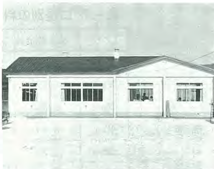
改修工事を終えた千住生活館

昭和三十八年に建てられた千住生活館の老朽化が著しいため、昨年度から二カ年計画で改修を行いました。昨年度は内部改修を、本年度は外部改修を行いました。