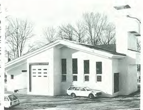
札内の中継ポンプ場