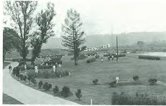
昨年8月にオープンした猿別川河川敷のサーモンコース

「住みよい町づくり」を目標に、本年度の予算は四本の柱で構成されています。①生活環境の整備 ②福祉と健康の充実 ③教育施設の整備 ④産業の振興。 広報七月号では、これら町づくりの具体的な計画をお知らせしましたが、実際にどう進んだのか今月号から二回に分けて特集します。