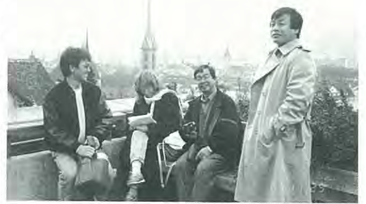
チューリッヒ（スイス）の街並みをバックに

スイスは本当に素晴らしい。山、湖、街並み、どこを見てもまさに絶景である。しかし急峻な山肌にはべりつくように建っている農家の家々を見ると、外観ではあるがかなり質素な生活であることが伺える。アイガー、ユングフラウの