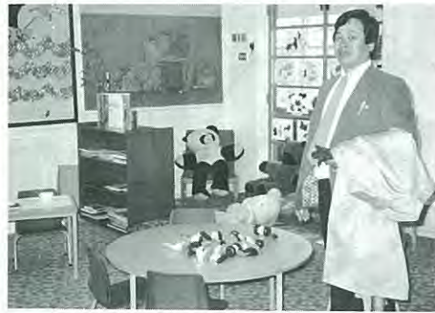
コペンハーゲンの子供の遊び場協会にて

場協会を訪問する。コペンハーゲンの街は緑が多い。街作りの基礎は公園が柱になるとか。二度の大火事と戦災をきっかけに区画整理を実施したとのことだが、かなりの荒療治をしたと思われる。何百年もかけて実施してきたと、こともなげに説明されたが、彼らのこの実行力はどこからくるのだろうか。続いて子供の冒険遊び場を訪