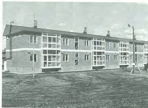
寿町に建設された町営住宅

道営、町営住宅の補修(畳表裏替え、給排水、建具など)や、四階建て住宅の赤水対策として給水管の清掃を実施しました。