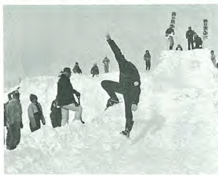
昨年の冬まつりでのミニスキー純ジャンプ