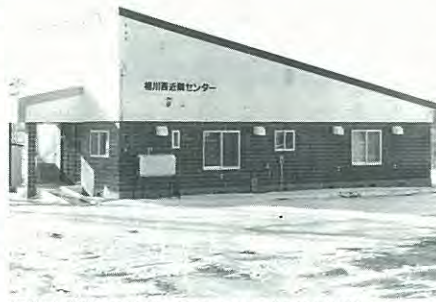
相川小学校の西側に建設された相川西近隣センター

北栄町近隣センターの増築を行いました。増築面積は約六十七平方メートルです。また、泉町近隣センターの駐車場の舗装を行いました。