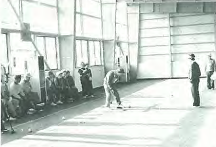
室内ゲートボール場でさっそくプレーを楽しむお年寄り