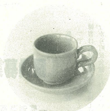
記念のコーヒーカップ

趣味の中で最も多いのが「音楽鑑賞」で七十三人(一八・四%)以下、「車」が六十人(一五・一%)、「スポーツ」が五十二人(一三・一%)の順になっています。これを男女別にみると、男性は「車」「音楽鑑賞」「スポーツ」の順となり、女性は「音楽鑑賞」「スポーツ」「手芸」の順となっています。問四でもふれますが、新成人たちの生活の中に「車」に関する事の占める割合が高いことがわかります。余暇の過ごし方について