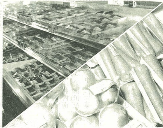
パック類が列ぶ商品棚