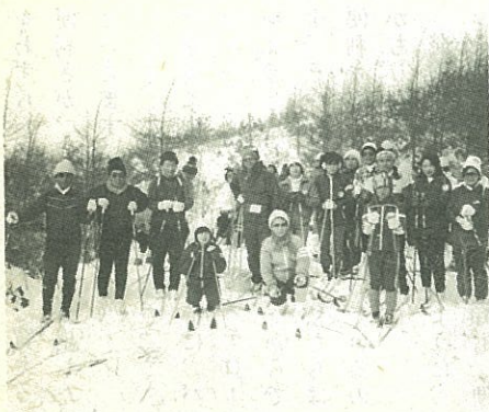
温泉周辺林道(十キロ)を歩き汗を流しました。

ま た、町民健康センターでは「糖尿病教室」など、糖尿病相談活動を行っています。糖尿病でお悩みの方は、ぜひ、ご相談ください。(☎4-2657)