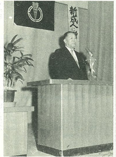
大石町長が「自分の行動に責任を持ち、力いっぱい人生を生きぬいて下さい」とお祝いのことばを.....

が最も多くて十四人(三二・六%)「職場の人間関係」が五人(一一・六%)の順になっています。また、「その他」と答えた人も多く調査後、新成人に聞いてみますと、「仕事を楽しめない」「ただ何んともなく」の考えもあるようです。