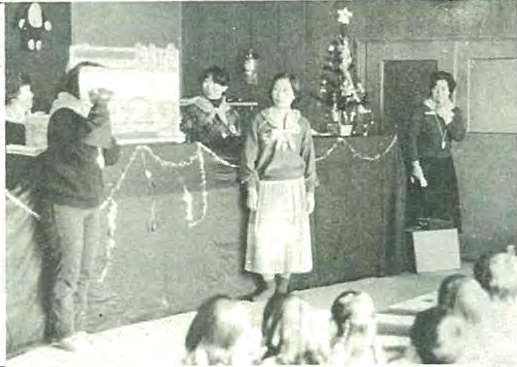
泉町公区のごくまクラブではお母さんたちによる指人形を使った交通安全教室を開き、楽しく交通安全を学びました。