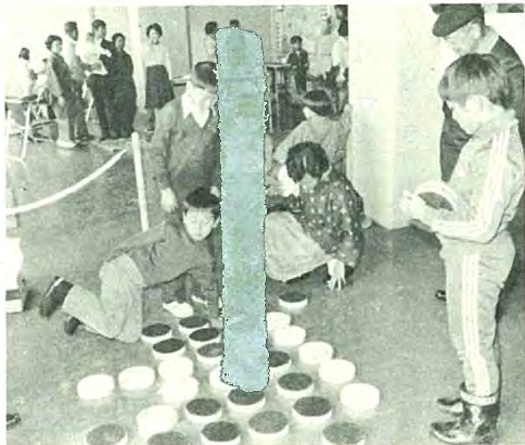
「ここへ置こうかなあ...」

集まった子供たちみんな二ウスをつきあげ、きな粉モチにして食べました。子供たちに付きそってきた大人のみなさんは、浪曲やクラシックなどのSPレコードで昔をなつかしんでいました。ご好評にお応えしてこの催しは来年もやります。