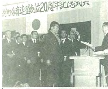
町体育連盟創立20周年記念式典が1月17日に町民会館で開催されました。