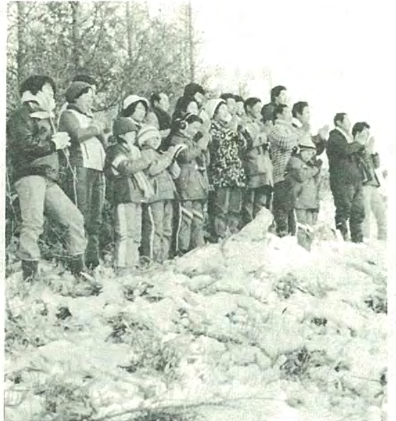
中里地区の皆さんは毎年元旦に家族そろって中里の通称ボウス山に登り初日の出を拝むことにしていますが、今年も40人の人が初日の出を拝み家内安全と豊作を祈りました。