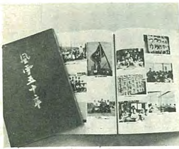
明倫開基開校50年を記念して記念誌「風雪50年」が発行されました。