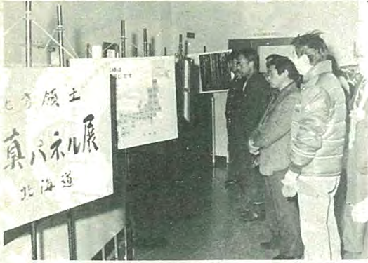
北方領土返還要求十勝支部大会が一月二十日札内福祉センターに二百人が参加して開かれました。

皆さんのマチの出来事をこのコーナーで紹介してみませんか。楽しい話題をお待ちいたしております。 (町民課広報聴係)