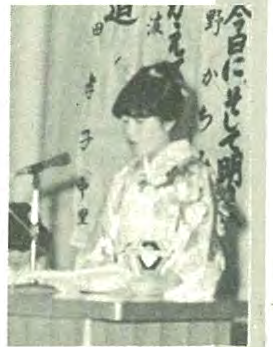
受付には和服姿の新成人でいっぱい 大石町長からのお祝のことは

夏期登校の一週間に二回の登校は、私にとって今までにはなかった大きな体験でした。今まで、家の手伝いはしていたけれど、毎日真剣に農作業に取り組んだこと