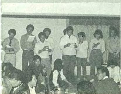
◀ 岡山の青年たちと交流を深める研修生一行

町並には、かわら屋根が軒を連らね垣根ごしに朱い実を付けた柿の木が顔を出すといった幕別では味わえない情緒があります。道路は狭く車がすれ違うのに不自由を感じるほどですが「互譲の精神」が守られ交通事故は少ないとのこと