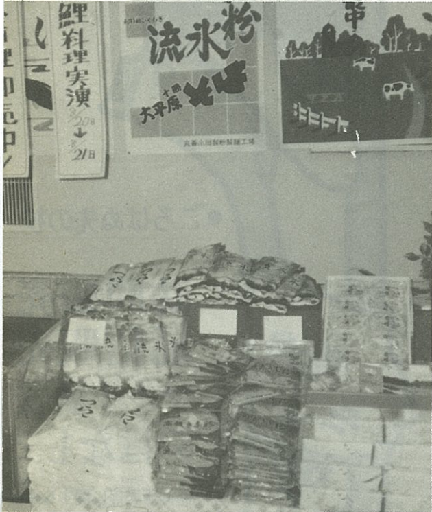
19日から23日まで藤丸デパートで開かれた物産展の幕別コーナー

また、交通違反のうち最も悪質な違反は酒酔い運転、スピード違反、無免許運転の三つですが、この交通違反三悪で検挙される町民も増加の一途をたどっています。帯広警察署のまとめによりますと、ことし一月から八月末までに