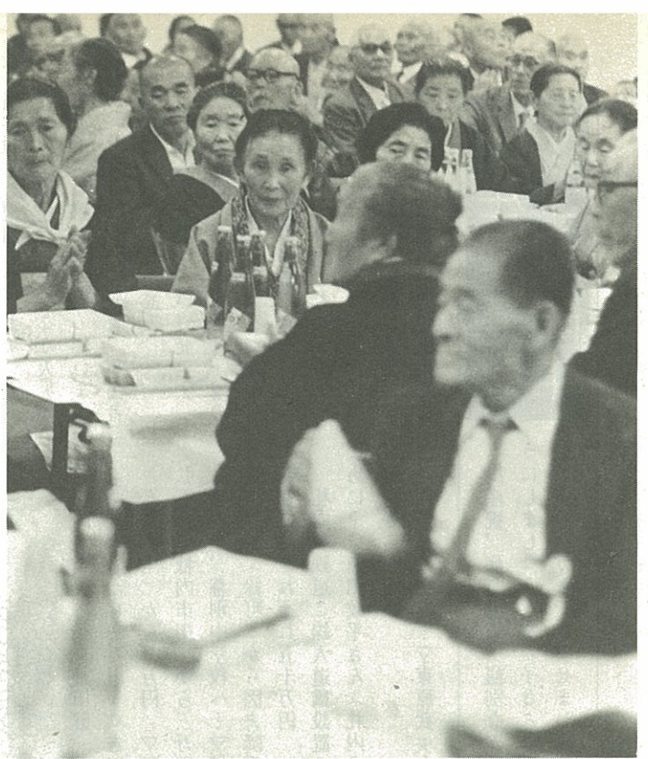
今年も元気な姿を見せてくれました（町民会館で）