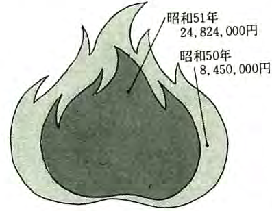
火災による損害額

とした不注意からだといえます。まだ暖房を離せない日が続きますが、火の始末を怠らないように