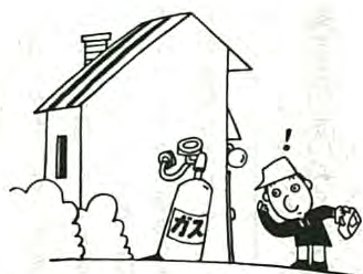
ホースからガスが漏れていないか、ボンベの置き場所、定期的な点検を。調整器の内部に雨ま

プロパンガスのボンベを屋外に設けるようになってから、冬期間にガスを使うとしたらガスが出ない、使用中にガスの出が止まってしまうとか、炎が異状に大きくなつたなどの現象はありませんか。