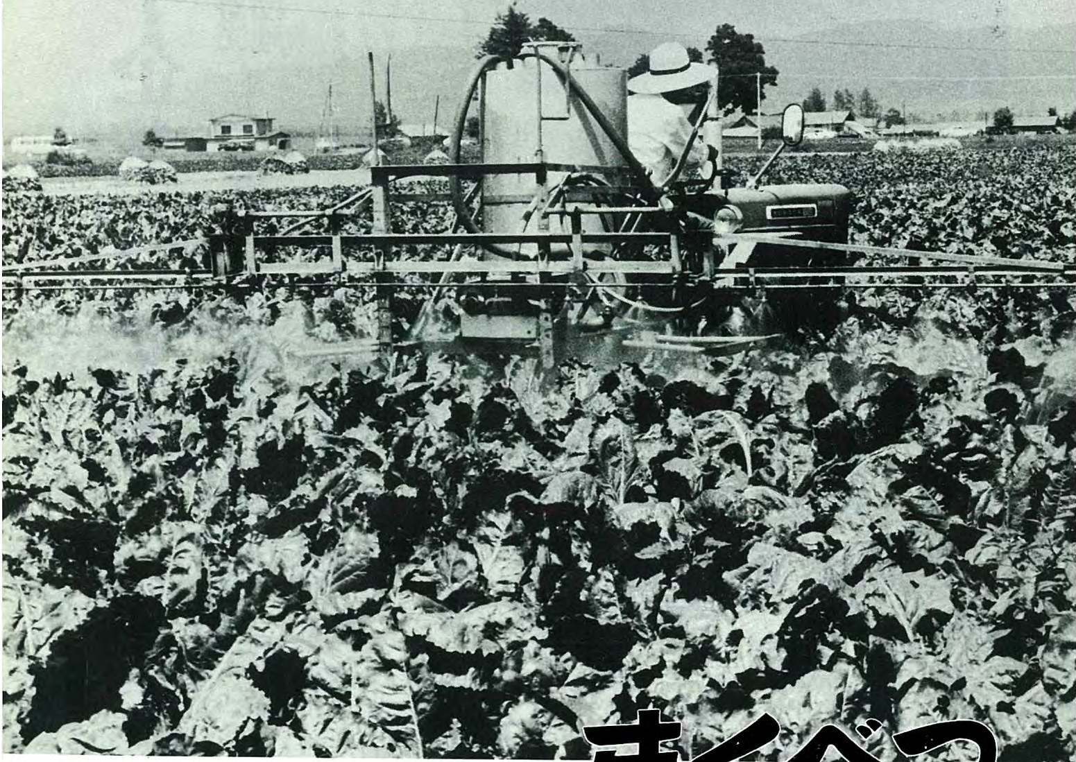
豊作を願って、トラクターによるビートの防除作業。