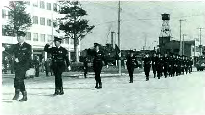
キビキビとした分列行進

募別町消防団恒例の出初式が一月五日・六日・八日の午前十一時から、各分団ごとに開催されました。各分団では出初式に先だつて神社参拝をおこない、団員の無事故と、ことし一年間の無火災を祈願しました。出初式の席上、表彰をうけた方は次の通り。