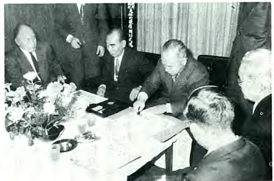
両町町長の盟約書の調印式