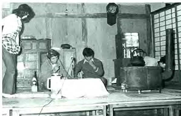
南幕別青年団の皆さん

この交礼会の席上、南幕別青年団の皆さんによる創作劇「雲の切れ間に」が上演されました。この物語りは昨年の台風二十号を素材とし、キャスト、スタッフ計二十一名の熱演に、会場を埋めた老友