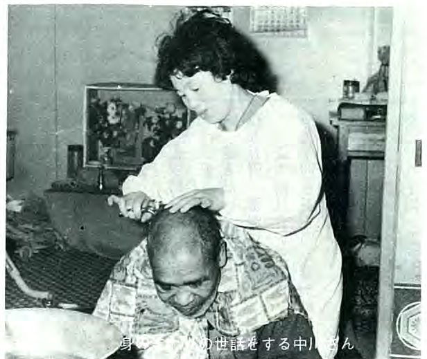
中川さんの世話を身にする

もこの苦難をのりこえ、今日の日本を築いてきたお年寄りたちから愛の手をさしのべることが、私たちのつとめではないでしょうか。