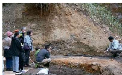
▲化石発掘見学ミニツアー