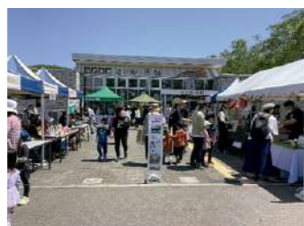
▲道の駅忠類登録30周年記念イベント(第1回)