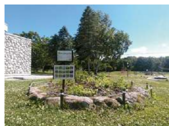
▲ Churui grass garden (忠類ナウマン象記念館)

岡山県倉敷市出身の本藤さんは、令和3年4月から地域おこし協力隊として活躍され、忠類地域の観光推進・魅力発信や情報発信にご尽力されました。