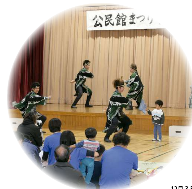
12月3日 糠内・駒島合同公民館まつり

☎問い合わせ ☎Eメール ☎HPホームページ ※【市外局番】☎0155 ☎01558