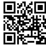
エシカル消費特設サイト(消費者庁)

買い物以外でも、食べ残しを減らす(食品ロスの低減)、3R(リユース(再利用)・リデュース(ごみを出さない工夫)・リサイクル)を心掛ける、省エネ・節電につながる行動を実践することもエシカル消費です。 新しい年を迎え、私たちの毎日の暮らしの中で、できることから少しずつ「エシカル消費」を取り入れてみませんか。