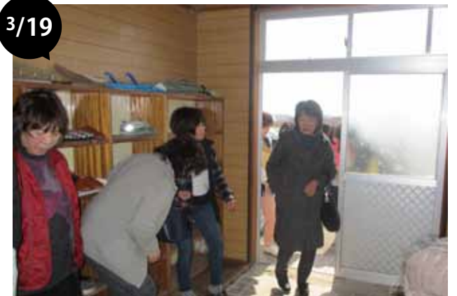
地震・津波避難訓練