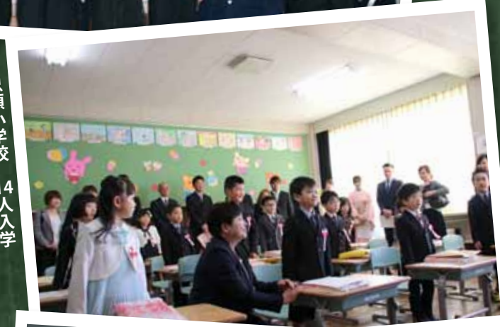
▶忠類小学校 14人入学