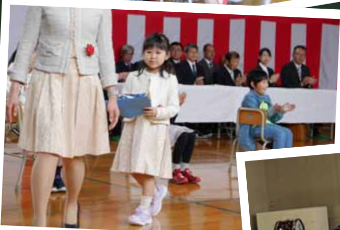
▶明倫小学校 1人入学