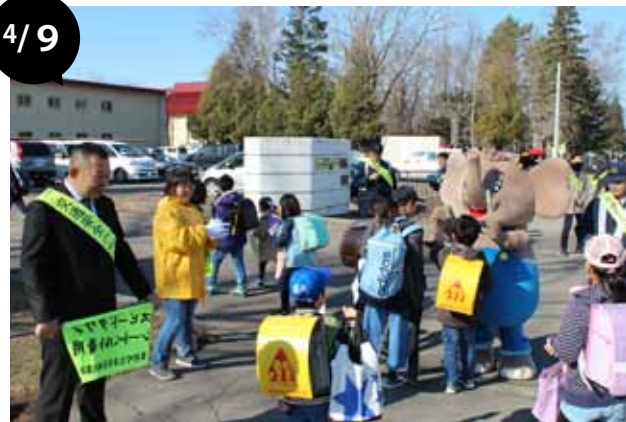
新入学児童街頭啓発