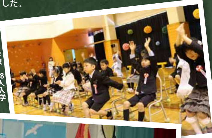
▶白人小学校 28人入学