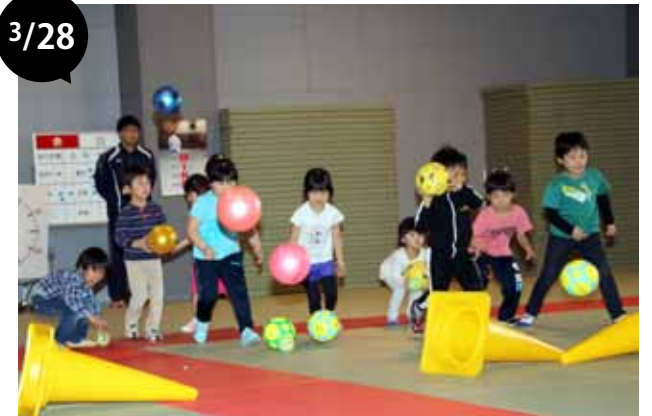
バルシューレ教室