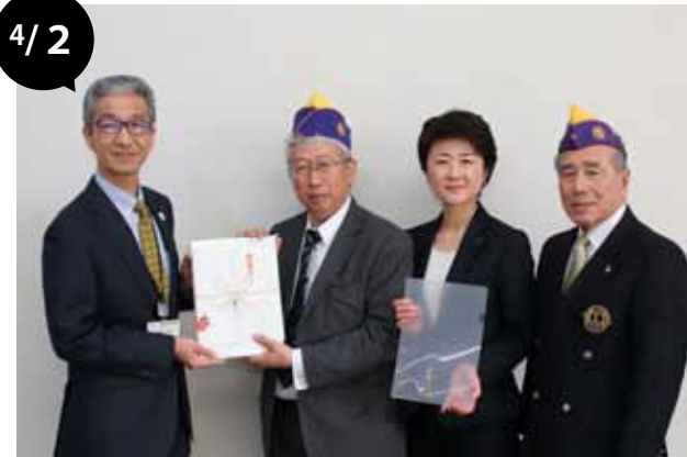
ライオンズクラブクリアファイル寄贈