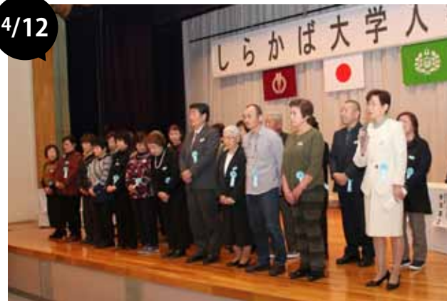
しらかば大学入学式