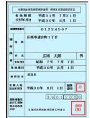
新しい減額認定証の色は水色です