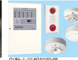
自動火災報知設備