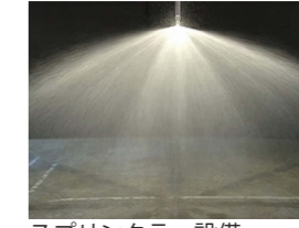
スプリンクラー設備