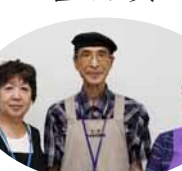
まくべつおもちゃの病院

平成18年の開院から、壊れたおもちゃを修理することで子どもたちの「ものを大切にする心や科学する心」を育ててこられました。