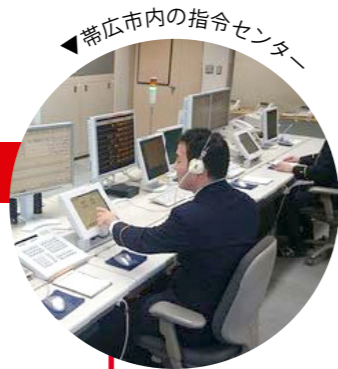
▼帯広市内の指令センター

すべての119番通報(FAX含む)は指令センターの指令台に入電されます。指令台では通報を受けると同時に、通報内容のモニターを開始します。