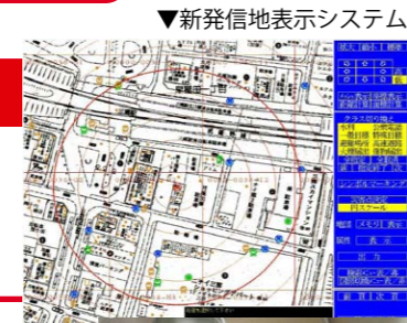
▼新発信地表示システム

通報内容や発信地表示システムで特定した災害地点の地図を地図等検索装置に表示し、正確な位置を確認します。