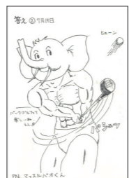
PN. マッスルパオくん