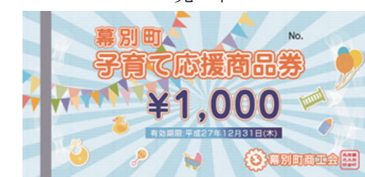
▲子育て応援商品券(表)