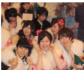
▲去年の成人式の様子