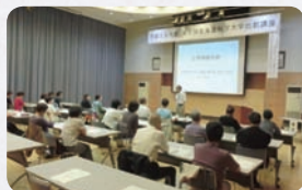
第2回講座 「自律神経の話」