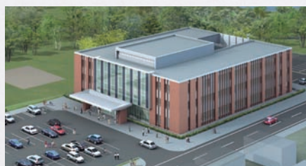
▲新庁舎完成イメージ図