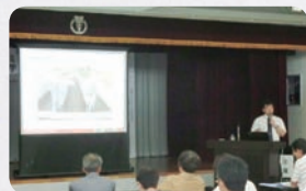
第1回講座 「自然エネルギーの有効活用」