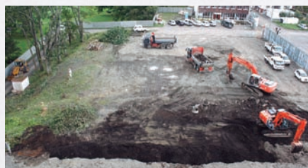
▲工事現場の様子(9月10日撮影)

新庁舎建設工事は平成28年3月の竣工を目指し、現在基礎工事のための準備を行っています。今後も新庁舎建設の様子を広報紙と町ホームページでお知らせしていきます。