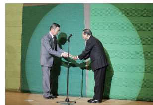
▲舞と歌チャリティの会様より