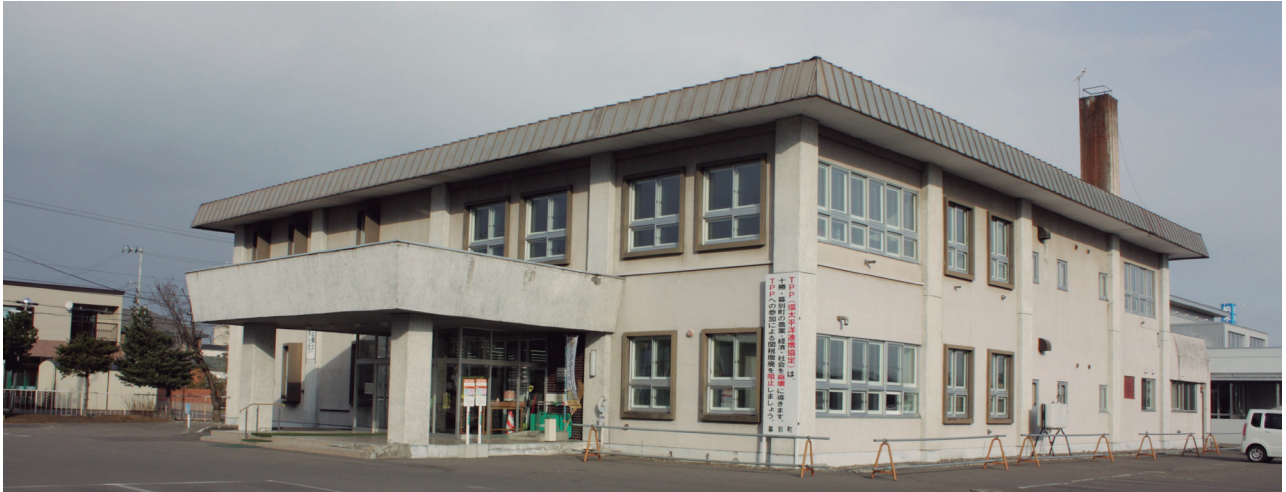
▲札内福祉センター（昭和49年4月に竣工し、平成26年4月で築後40年が経過します。）

◆施設の利用状況は、軽スポーツを行う目的で平日の日中（午前と午後）に大集会室を利用する団体が多く、利用頻度は、週1回や月数回の単位で2〜3時間での利用が多い