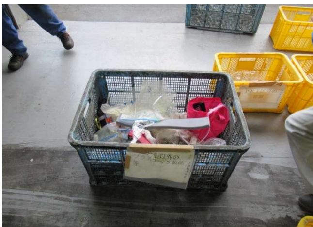
1 容器包装以外のプラスチック製品等 プラスチック製のハンガーやおもちゃなどの製品プラスチックは燃やせないごみです。