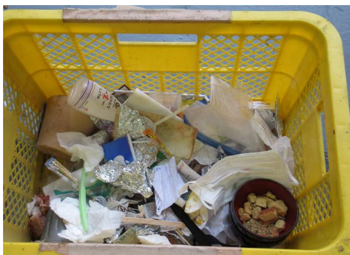
5 その他①（衣類・履物、木屑棟の異物）