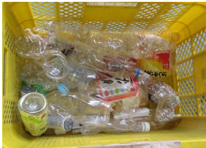
2 PET区分の容器 プラではなくペットボトルとして出してください。