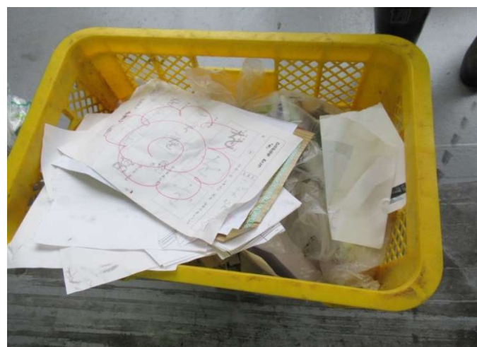
6 その他②（衣類・履物、木屑棟の異物）