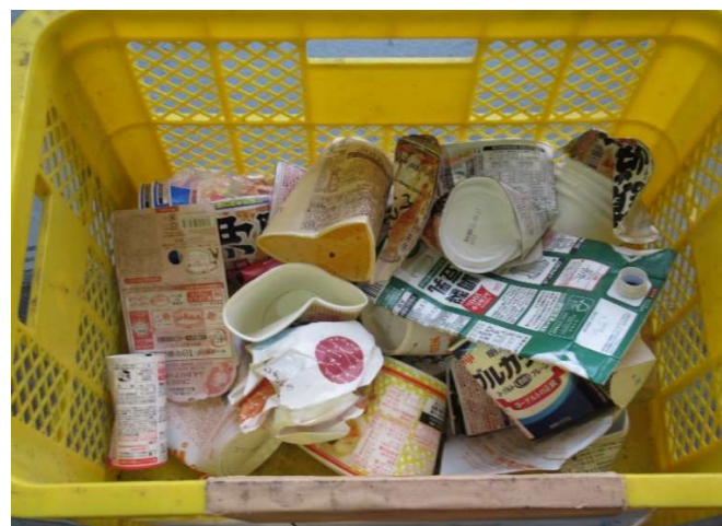
4 他素材容器包装 紙製容器包装に出してください。