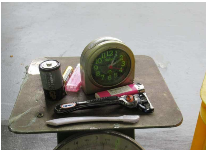
3 禁忌品（危険品） 作業員がケガをします。絶対に入れないでください。