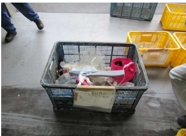
1 容器包装以外のプラスチック製品等 プラスチック製のハンガーやおもちゃなどの製品プラスチックは燃やせないごみです。