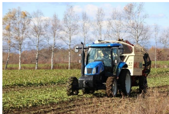
「ハーvesterでのビートの収穫 (11月上旬)」

農業界全体の問題として、私たち若い世代は農家戸数の減少にも対応していかなければいけません。農家戸数の減少は、一戸あたりの耕作面積を増加させ、労働力不足を生みます。令和の時代は、農業機械の大型化、効率化が重要視されることでしょう。経営規模が拡大すれば、農業にかかわる時間が増し、家族と過ごす時間が削られてしまうこともあり得ます。そうなれば、農業の魅力が半減してしまいます。次世代に魅力的で持続可能な農業を引き継いでいくためには、農作業の効率化により労働生産性を向上させ、労働時間を増加させない取り組みを進めていく必要があります。