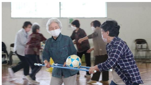
「忠類シニアクラブ スポーツ大会」

転入してすぐに忠類老人クラブに入会しました。クラブの行事や会合に参加することで、地域のみなさんとのつながりが強いものになっていくのを肌で感じながら、平成16（2004）年にはクラブの会長職を拝命しました。記憶に強く残っているのは、平成18（2006）年の幕別町との合併の時です。クラブの名称をシニアクラブに変更することを提案しました。シニア世代が地域づくりの担い手として活動して年齢を重ねていく、アクティブエイジングの考えの下に活動を進めようと考えたのです。以来17年、伝統ある行事を大切にしながら、会員相互の親睦を図ってきました。忠類シニアクラブ発足当時108名を数えた会員数は、令和4（2022）年には50名となり半減してしまいました。この50名という数は、地域の60歳以上の人口の約30%にあたります。地域社会づくりに貢献するシニア世代のつながりを広げていくことが、今、忠類シニアクラブに求められていることだと考えています。