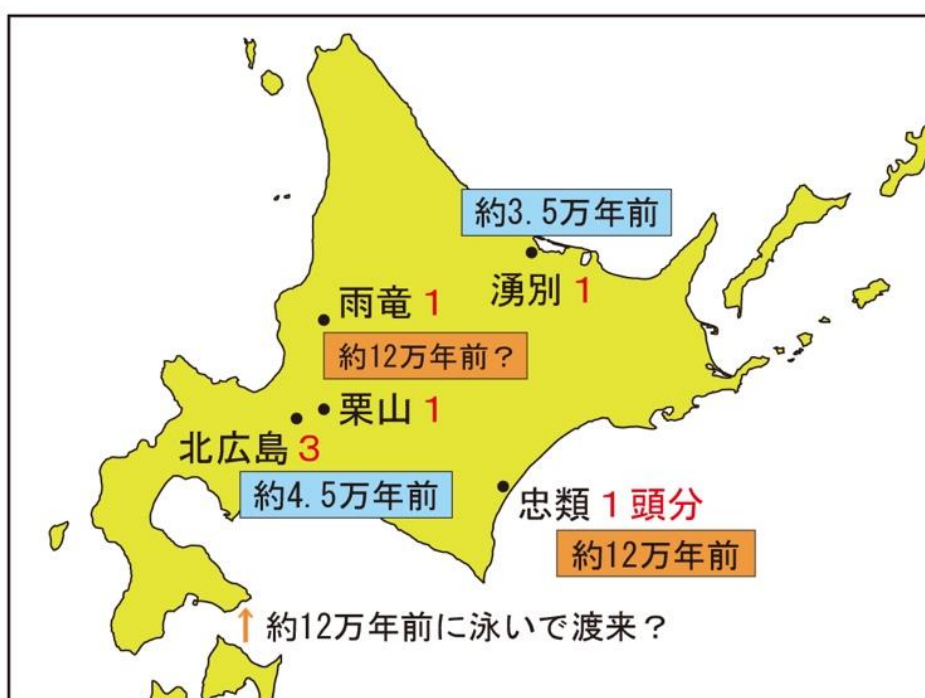
図1 ナウマンゾウ化石の発見地と産出

北海道では忠類の他に4地点で臼歯化石が発見されています(図1)。忠類標本よりも前に発見されていた雨竜および栗山標本の年代も約12万年前とされていますが、具体的な産出層が不明で確実ではありません。したがって、忠類標本が北海道最古と言えます。また、北広島標本(3点のうち1点)と湧別標本は約4.5万年前と約3.5万年前という年代が得られていますが、この頃はマンモスゾウも生息していたほど今より寒冷な氷期で、南方から来たナウマンゾウが環境に適応していた様子が見られます。