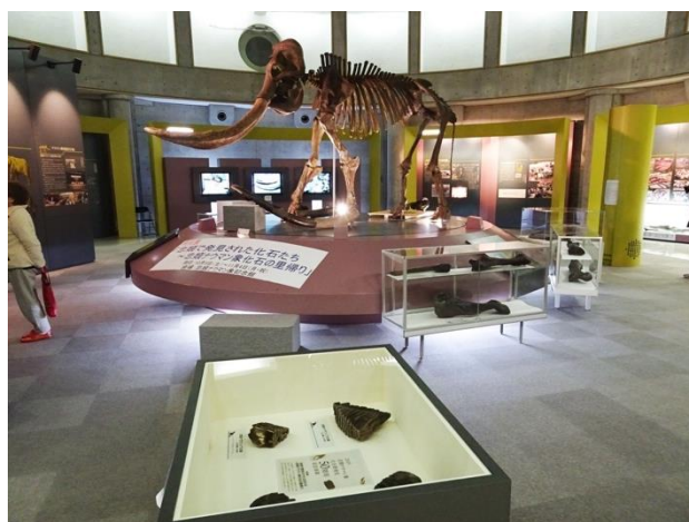
写真6 特別展の様子

また、これからも子ども達を含めた地域全体が忠類ナウマン象と共に歩んで行けるような企画が必要と思い、忠類小学校と札幌市円山動物園に協力を依頼し「かぼちゃプロジェクト」を始動しました。同園では、普段から動物達の糞を元に堆肥を作っており、近隣の小学校や児童会館へ提供して野菜栽培に活用してもらっていました。そこで、その堆肥を使って忠類小学校の学校農園でかぼちゃを育て、動物園のゾウへプレゼントすることにしたのです。当時の円山動物園は11年振りにアジアゾウを導入し、一般公開を間近に控えていた時でした。現代と古代のゾウがつないだ、忠類地域ならではの企画です。