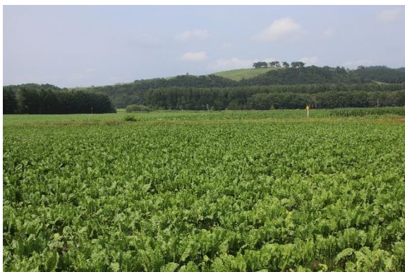
「青々と大きく葉を広げるビート (8月上旬)」

畑作経営に新しい考えをもたらし、必ず私の経営の強みになると確信するようになりました。