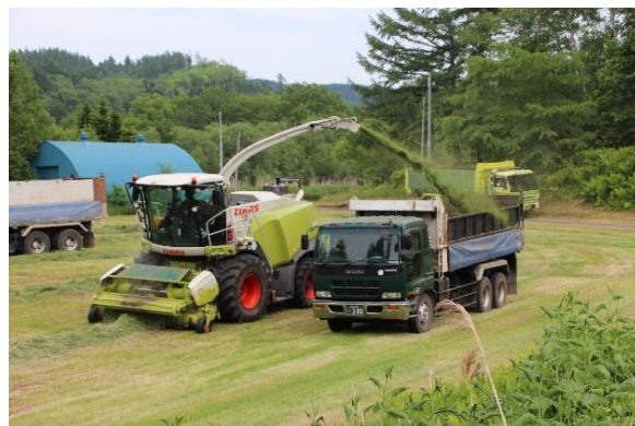
「一番牧草の収穫 ～機械の大型化が進む農業～」

一方で、今後は農業と観光が結びつく面が多くなります。全国的に各地が都会化される中で、農村は唯一の癒しの場として人々が訪れるようになります。それは農業を観光化するのではなくミニ観光牧場や加工施設の設置等で、高規格道路の整備が進み道路事情の変化に伴う通過型の観光客を引き寄せる手段にもなると思います。今後の傾向として、農業を中心とした観光には住民のみなさんが知恵を出し合う重要な課題であると思います。本地域には、ナウマン象を中心にしてコンパクトながら豊富な観光資源があります。その活用についても深く関心を持つことです。