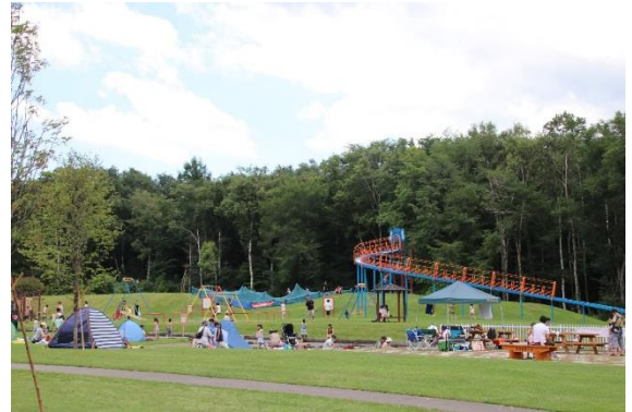
「家族連れでにぎわうナウマン公園 なが〜い滑り台付近」