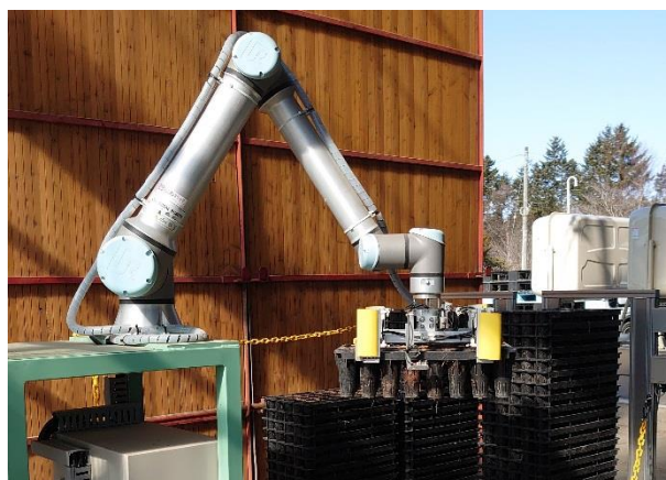
「ポットを運ぶ協働ロボット “日本の農業分野で初の導入”」