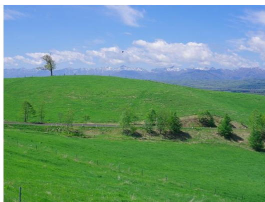
「自然のキャンバス ～共栄の丘そして日高山脈～」

「それじゃ、日高山脈を、貼り絵にしたらどうだろう。先生も日高の風景が一番だと思う。」六年生の時、卒業記念のテーマを決めるホームルームの時でした。普段から日高山脈に惚れ込んでいた担任の先生が、皆に混じってアドバイスを出したのです。材料は、家に余っているハギレを集め、レイアウトした鉛筆画に貼っていく。色とりどりの布が大量に集まりました。大きさはベニヤ板を縦に六枚並べたもので、とにかく大きく、それは、当時の体育館の大壁に展示するための、相応しい大きさでした。ベニヤ板は大キャンバスとなり、先生も児童も、四つん這いになって、風景の輪郭を描いていきます。それを見て、卒業生の思いが一つになり、日高のイメージが膨らんだのです。