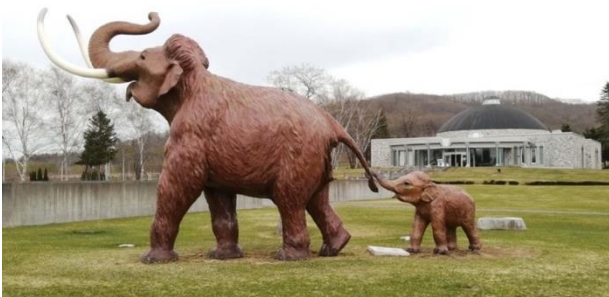
写真2 忠類ナウマン象記念館の前庭にある生態復元模型

約12万年前の北海道は現代とほぼ同じ環境ですから、冬季には雪が降り気温も氷点下が続く時期があったと推定されます。十勝の冬の寒さは特に厳しいものです。忠類ナウマン象は、現在のヒグマやキタキツネ同様に尻尾も含めて全身を体毛で覆うことで厳しい冬を越しつつ夏毛と冬毛を持つことで季節変化に対応し、耳はアジアゾウやアフリカゾウのように大きく進化しなかったと推定されます（写真2）。