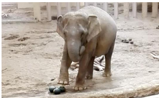
写真7 かぼちゃを食べる アジアゾウ

また、これからも子ども達を含めた地域全体が忠類ナウマン象と共に歩んで行けるような企画が必要と思い、忠類小学校と札幌市円山動物園に協力を依頼し「かぼちゃプロジェクト」を始動しました。同園では、普段から動物達の糞を元に堆肥を作っており、近隣の小学校や児童会館へ提供して野菜栽培に活用してもらっていました。そこで、その堆肥を使って忠類小学校の学校農園でかぼちゃを育て、動物園のゾウへプレゼントすることにしたのです。当時の円山動物園は11年振りにアジアゾウを導入し、一般公開を間近に控えていた時でした。現代と古代のゾウがつないだ、忠類地域ならではの企画です。