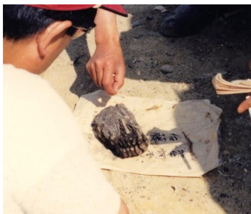
写真3 発見時のマンモスゾウ臼歯

今のところ北海道で足跡化石が発見されているのは忠類だけで、2019年と2020年には「忠類ナウマン象化石発見・発掘50周年記念事業」の一環として、幕別町教育委員会が主体となり発掘調査が行われました。2020年は大小23個もの凹みが確認され(写真4)、シリコンや石膏で型を取り分析を進めています。新型コロナウイルス感染症の影響で分析が進まず、足跡をつけた動物の特定には至っていませんが、凹みは大小複数あるため、ゾウ以外の動物の足跡も含まれている可能性があります。北海道の12万年前の化石は少ないことから、今後、忠類の足跡化石を研究することは、太古の北海道を探る上で極めて重要になるでしょう。