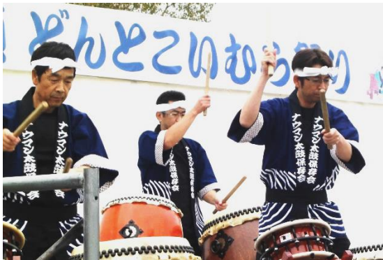
「ナウマン太鼓 （どんとこいむら祭りにて）」

私は忠類生まれです。16歳から15年間を札幌で過ごし、2006年11月に忠類へ戻った時、「忠類村」は「幕別町忠類」になっていました。その後、忠類地域住民会議や商工会青年部の活動の中で、村出身を恥ずかしがる忠類っ子がいること知り驚きました。私は「ナウマン象が発掘された忠類村出身です。」と自慢げに話し、誇りに思っていたので、“忠類の良さや、私が知っている忠類のみなさんの温かさを子ども達に伝えていきたい。”と考えるようになりました。