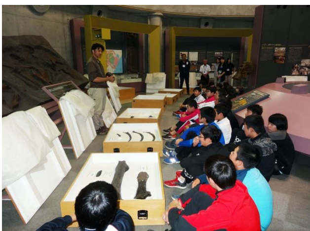
写真5 原標本を前に忠類の子ども達へ解説

以上の研究成果は、2019年度の「忠類ナウマン象化石発見50周年記念事業」で開催した特別展で紹介し、最新情報を知ってもらう機会としました。そして、北海道博物館と共催とすることで、初めて忠類ナウマン象の全ての化石（原標本）を里帰り展示することができました。このことによって、約50年前の発掘現場を見学した忠類地区の皆様には当時の感動の記憶をより鮮明に思い出してもらえたと思っています。さらに、忠類発展の基盤にこの化石があったことを子ども達にも体験学習を通して理解してもらうため、忠類ナウマン象記念館での展示設営時に忠類小・中学校の児童・生徒を招き、原標本を間近に見てもらいながら50年前の発見・発掘のことや近年の研究成果について解説しました(写真5、6)。