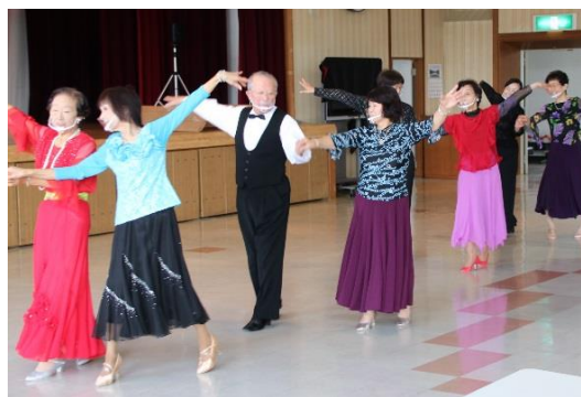
「ナウマン校ダンス科の発表 （しらかば大学大学祭にて）」

しらかば大学ナウマン校のダンス科で活動しています。科のみなさんと月に1回、社交ダンスをはじめ各種ダンスを楽しんでいます。あるテーマをもって一定時間に体を動かすことは健康によいことはもちろん、みなさんとのコミュニケーションを図る場にもなっています。大学という名称から、堅苦しいイメージを持たれる方もいらっしゃると思いますが、どの科も和気あいあいと家族のように活動しています。同好の仲間、共同体として活動することは、正しくコミュニティです。このコミュニティしらかば大学は、卒業を考える必要のない大学（活動）です。活動の質を自分で考え、活動の質を急に低下させることなく、年齢を重ねていける大学（活動）です。