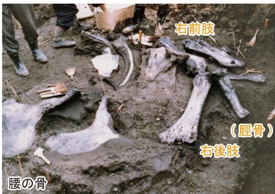
図3 急斜面上にある右肢の骨化石

全体的に写真右から左（北から南）に傾斜し、茶色い上着の人物の前付近は特に急斜面（段差）になっています。