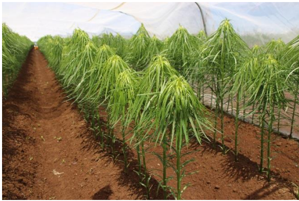
「病にならないように ビニルシートで覆われた種百合」

いけたらいいなと思っています。まずは産地の若い世代から百合根を食べる文化を根付かせていくことが百合根の未来、ひいては『忠類の未来』につながるとしています。十勝管外からやってきた私を優しく受け入れてくださったこの地域に少しでも貢献できるように、百合根農家として今後も頑張っていこうと思います。