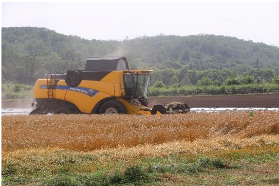
「麦秋(7月) ～新型コンバインでの刈り取り～」

私は大学へ進学し、卒業後はアイスホッケー選手として活動しました。しかし、農業経営者になりたいという気持ちは捨てることはできませんでした。平成25(2013)年に兄との共同経営の可能性を模索するために帰郷しました。それから2年間農業に従事しましたが、私の心の中に「経営のトップとして判断をし、その判断に責任を持って農業を行いたい。」という考えが徐々に大きくなっていくのを感じました。そこで、私は独立して農業をやることを決意し、就農地を探すことにしました。十勝管内のJAに足を運び、就農について話をしましたが、どのJAでも簡単に断られてしまいました。そんな時、私の話に耳を傾けてくれたのがJA忠類でした。