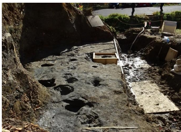
写真4 2020年の足跡化石調査風景