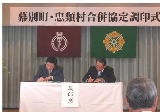
「幕別町・忠類村合併協定調印式 平成17(2005)年2月25日」

私は、合併の成果を論じるには、「合併から20年は時間が必要だ。」と、当時から言い続けてきました。地域のみなさんの建設的なご意見を町当局に届けていただき、今後も忠類地域の発展を見守っていただきたいと思います。