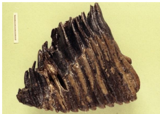
写真1 発見当時に撮影された臼歯化石

なお、「ゾウ」の表記はアフリカゾウやアジアゾウなど一般的に使用されるカタカナとしましたが、忠類標本についてはこの地で親しまれ定着している「忠類ナウマン象」と漢字で表記します。