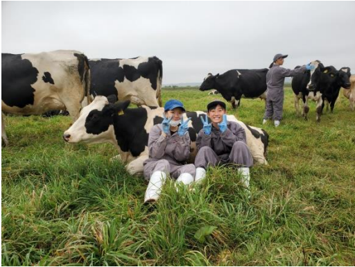
「笑顔の高校生（放牧地にて）」

平成21（2009）年に浦幌町で試験的に始まった都会の高校生のホームステイ受け入れが、翌平成22（2010）年には忠類でも2軒の酪農家からスタートしました。以降、令和元（2019）年までの10年間で、のべ23,000余名の高校生が十勝にやって来てホームステイを体験しています。令和2（2020）年・令和3（2021）