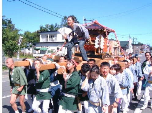
「ナウマン象の神輿 （忠類神社秋祭りにて）」

忠類の大人のみなさんは私に沢山のことを教えてくれました。忠類音頭やナウマン太鼓を残したい気持ち、忠類ナウマン