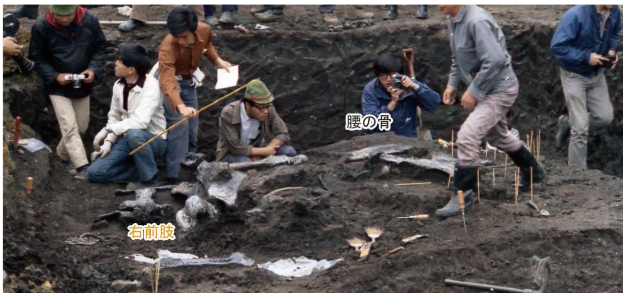
図2 1970年の発掘調査風景

位置していたため垂直状になっていたこと、すなわち沼に足を取られた結果ではないことが判明したのです（図2、3）。また、「第三泥炭層」で確認された多数の足跡化石も、足を取られて動けなくなるような地面ではなかったことを裏付けています。