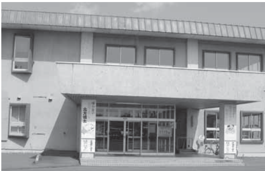
札内福祉センター