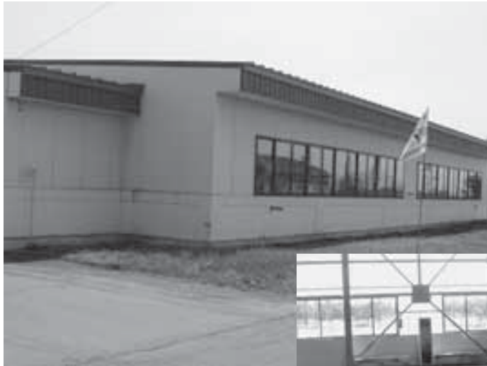
幕別地区の室内ゲートボール場