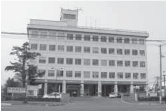
行政改革を進める役場